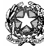
Ministero dell'Istruzione, Università e Ricerca