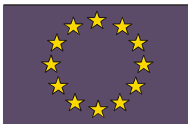
Comunità europea Fondo Sociale Europeo

Il Programma Operativo Nazionale, "Competenze per lo sviluppo" (F.S.E.) intende incidere sulla preparazione, sulla professionalità delle risorse umane e sugli esiti degli apprendimenti di base per realizzare più elevate e più diffuse competenze e capacità di apprendimento di giovani e adulti.