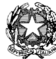
Ministero dell'Istruzione, Università e Ricerca

Istituto Comprensivo di Altavilla Silentina Via Peschiera n. 84/86 84045 Altavilla Silentina (SA) Tel.: 0828 982029 Fax: 0828 982029 E-mail: saic83300p@istruzione.it Sito Web: www.icaltavilla.it