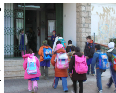
Ritorno a scuola