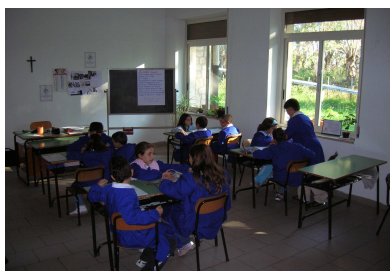
I gruppi al lavoro

Nel mese di ottobre gli alunni di 4 a e 5 a hanno condiviso un'interessante esperienza di lavoro per gruppi.