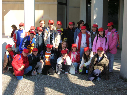
Gli alunni di 4ª e 5ª - S.P. "Scanno"

stata alle terme Rosa Pepe. Il proprietario ha subito rassicurato tutti circa la "puzza" che si levava da quelle acque e, dopo aver spiegato gli effetti benefici di quelle terme,